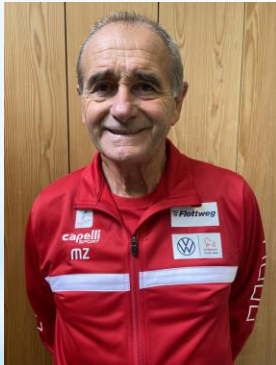
A-Lizenz-Trainer, Jugendtrainer der Roten Raben Vilsbiburg